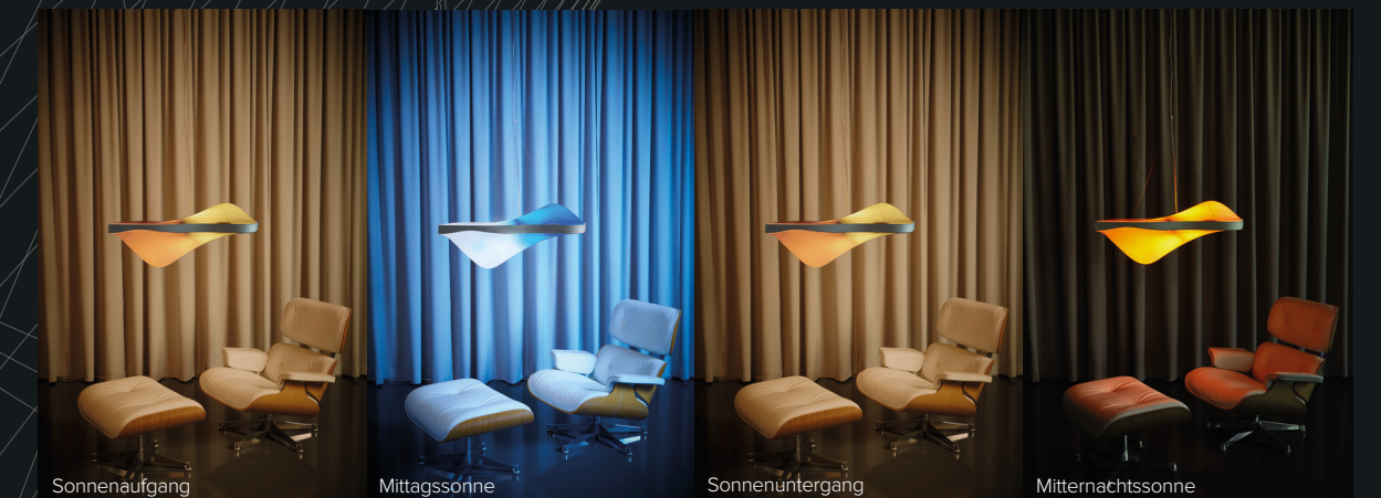
Sonnenaufgang Mittagssonne Sonnenuntergang Mitternachtsonne