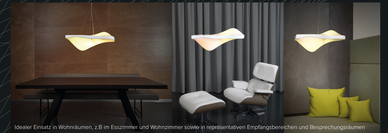
Idealer Einsatz in Wohnräumen, z.B im Esszimmer und Wohnzimmer sowie in repräsentativen Empfangsbereichen und Besprechungsräumen